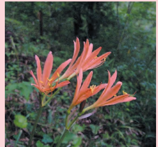
キツネノカミソリ 花期8～9月