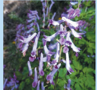
ムラサキケマン 花期4～6月