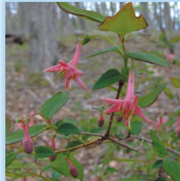
ミヤマウグイスカグラ