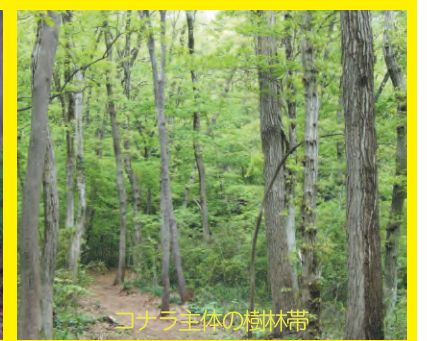
コナラ主体の樹林帯