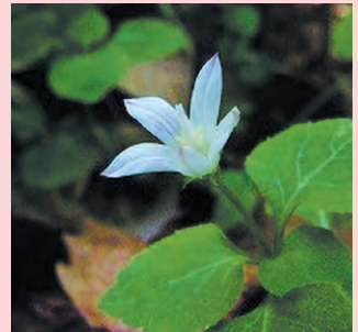
タニギキョウ 花期6～8月