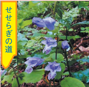
ラショウモンカズラ 花期4～6月