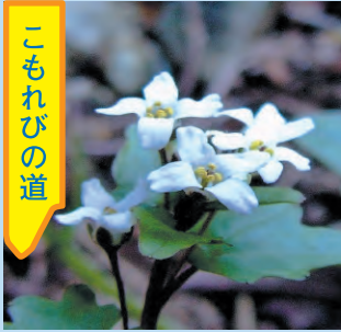
ユリワサビ 花期3～5月