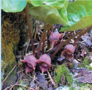
トウゴクサイシン 花期4～5月