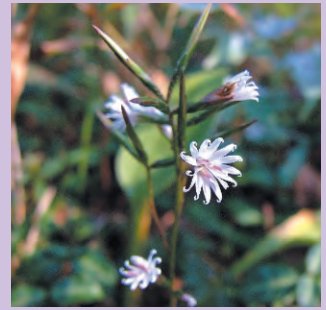
キッコウハグマ 花期9～11月