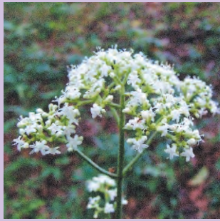
オトコエシ 花期8～10月