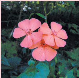
フシグロセンノウ 花期8～9月