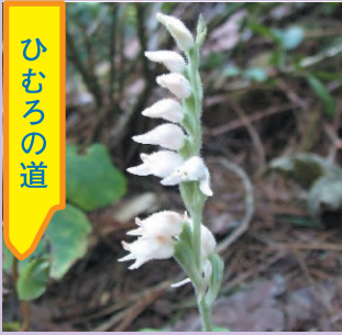
ミヤマウズラ 花期8～9月