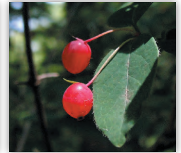
ミヤマウグイスカグラ